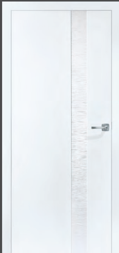
TEXTURA 03: Weiß matt/Reliefstruktur Schilf

Partielle Strukturflächen auf schlichtem Weiß erzeugen Kontraste, die sich nicht nur toll anfühlen, sondern auch für neue Licht- und Schatteneffekte sorgen. Zum Beispiel die Reliefstruktur Schilf von Textura sowie die Holzstruktur Lärche gebürstet von Kontura.