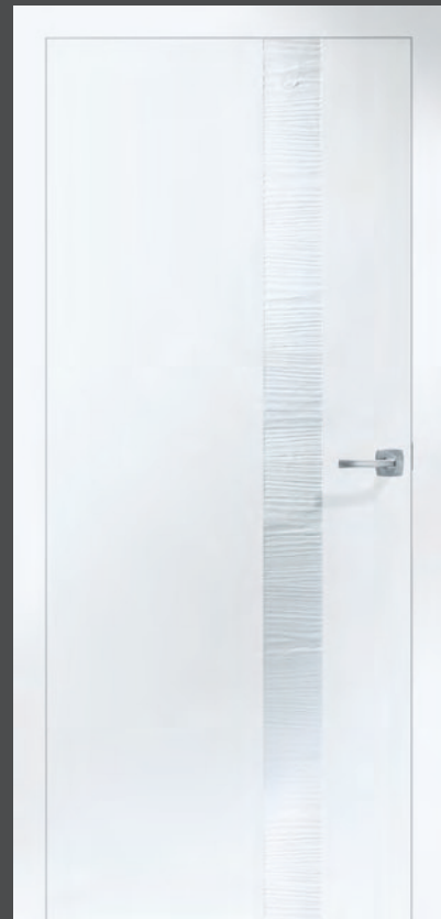
KONTURA 03: Weiß matt/Holzstruktur Lärche gebürstet