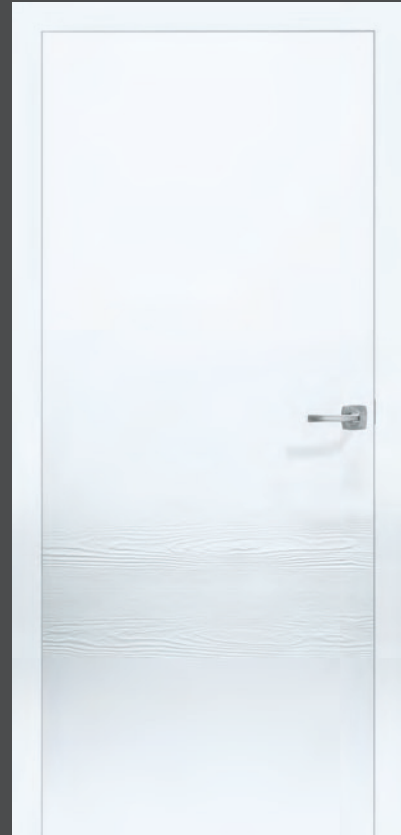
KONTURA 02: Weiß matt/Holzstruktur Lärche gebürstet

Partielle Strukturflächen auf schlichtem Weiß erzeugen Kontraste, die sich nicht nur toll anfühlen, sondern auch für neue Licht- und Schatteneffekte sorgen. Zum Beispiel die Reliefstruktur Schilf von Textura sowie die Holzstruktur Lärche gebürstet von Kontura.